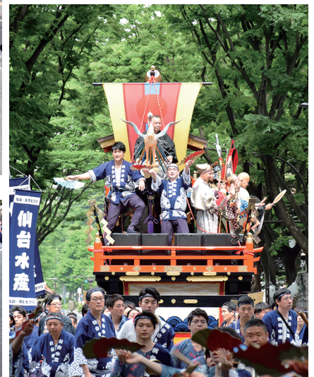
▲笛と太鼓、鐘のお囃子隊20人が盛り上げた