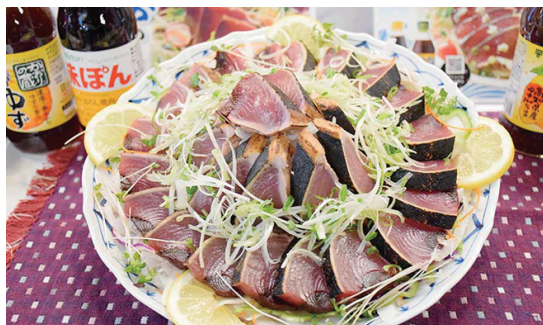
▲旬の野菜と食べる「カツオのつけ盛り」を試食提案した