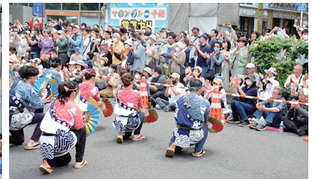
▲大観衆から大きな喝采と拍手を浴びる