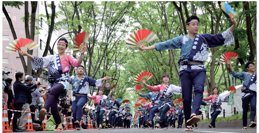
▲宵まつり「すずめ踊り大流し」、元気に明るく、軽快な舞いを披露した仙水神船組