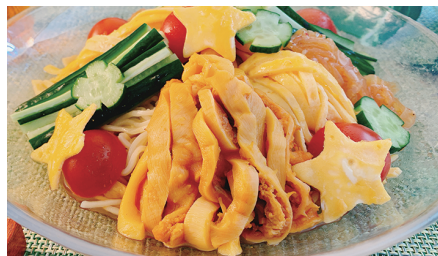
▲旨味をツルっと! 具材たっぷりほやし中華

調理法を変えることで、食わず嫌いのお子さんや今まで苦手だった方にもおいしくいただける場合があります。宮城の味をぜひ味わってみてください。