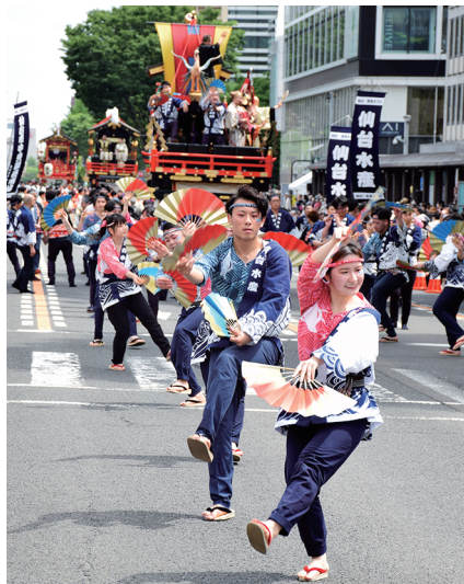
▲御神船山鉾の前で軽快なすずめ踊りを披露