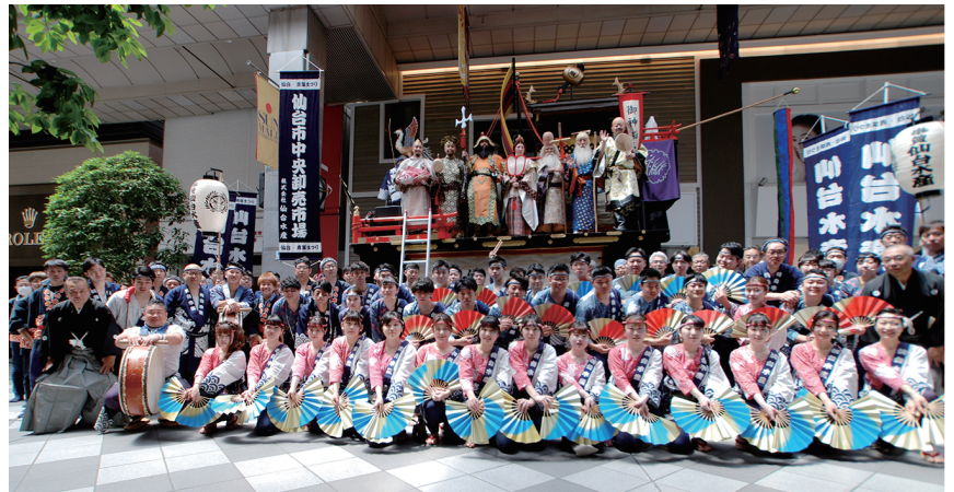
▲本まつり出陣前、御神船山鉾の前で集合写真