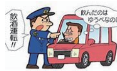
▲前夜の酒にご用心!

飲酒運転による交通事故が依然として後を絶たない状況にあります。飲酒運転は大切な6つの宝を奪います。①命(死亡事故に直結)②家族(離散、崩壊など)③仕事(会社は懲戒解雇に)④社会的信用(新聞、テレビなどで報道)⑤免許(免許取消し)⑥お金(遺族補償や罰金刑)※死亡事故などを起こせば生活は破綻し、一生償っても取り返しのつかない犯罪者になります。朝が早い市場の方々は、二日酔い運転しないよう、前夜の飲酒に配慮が必要です。