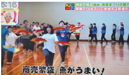
▲青葉まつり特集で仙水グループを紹介5/17

本番まで10日を切り練習も大詰め。練度が上がり笑顔で元気いっぱいの踊りを、新入社員らの踊りにかける意気込みコメントとともに放映されました。