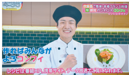
▲みやぎの美食! 銀鮭ロマンコンフィ

5月12日(第2金曜)ミヤギテレビの人気情報番組「OH! バンデス」の「ムッシュのおさかな道場」。今回の料理は、養殖生産量全国第1位の銀ザケを使ったフランス料理「銀ザケロマンコンフィ」。食材を低温の油でじっくり煮て、素材の旨みをしっかり閉じ込めた一品です。家の炊飯器でも簡単に作れます。これを作れば皆がよろこぶコンフィです!